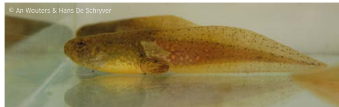
© An Wouters & Hans De Schryver