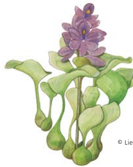
© Lies Op de Beeck @ RBINS

Jacinthe d'eau × Water hyacinth × Wasserhyazinthe