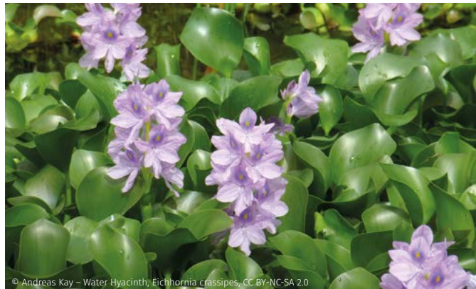
© Andreas Kay - Water Hyacinth, Eichhornia crassipes , CC BY-NC-SA 2.0

De soort kan dikke, drijvende matten vormen op het wateroppervlak en zo de inheemse vegetatie verdringen, lichtinval doen dalen en zuurstofgebrek veroorzaken wanneer deze matten afsterven en het debiet van het waterlichaam doen afnemen. Dit heeft ook gevolgen voor de inheemse fauna en gebruiksfuncties van het waterlichaam.