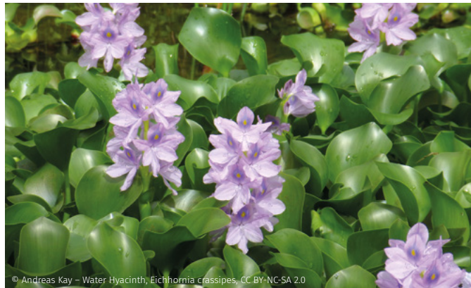
© Andreas Kay - Water Hyacinth, Eichhornia crassipes , CC BY-NC-SA 2.0

Cette espèce forme des tapis denses flottant à la surface de l'eau, ce qui entrave le développement de la végétation indigène et peut provoquer l'eutrophisation du plan d'eau en raison de l'accumulation de matière organique morte. Cela peut avoir des conséquences importantes sur la faune indigène, le débit de l'eau et les fonctions récréatives des plans d'eau.